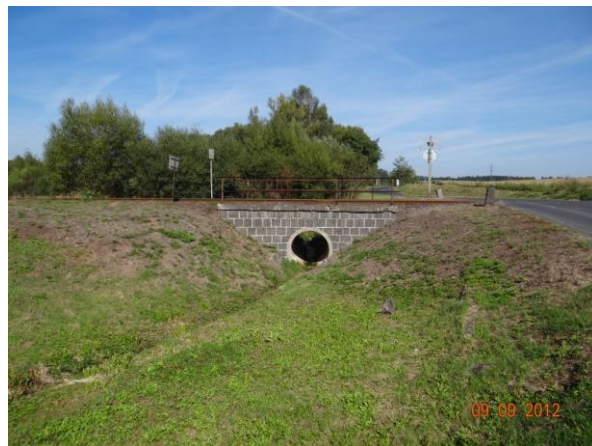
Hlavní propust v tělese železnice. Druhá propust neudržovaná.