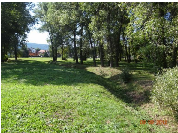
Koryto toku v parku.