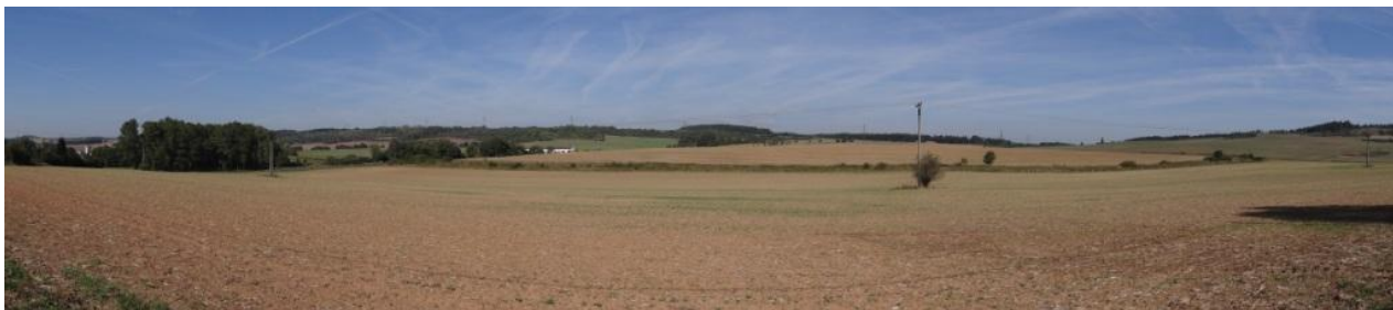
Celkový pohled na část sběrné plochy.