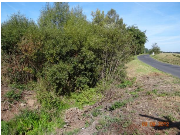
Neudržované koryto nad železničním přejezdem.