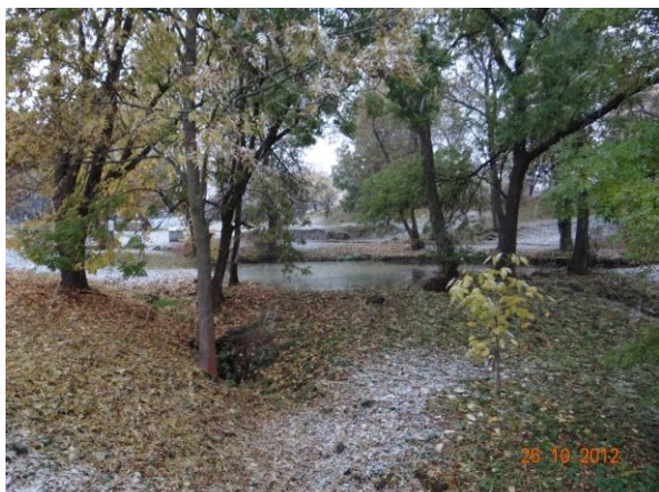
Návesní rybníček s přepadem.