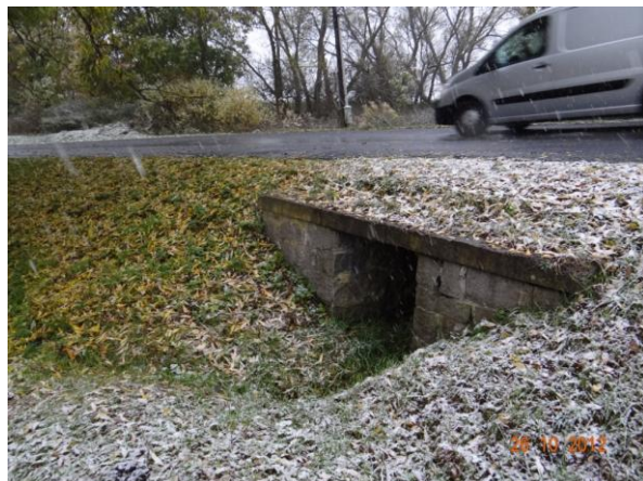
Propustek pod komunikací II/194. Může dojít k přelití komunikace.