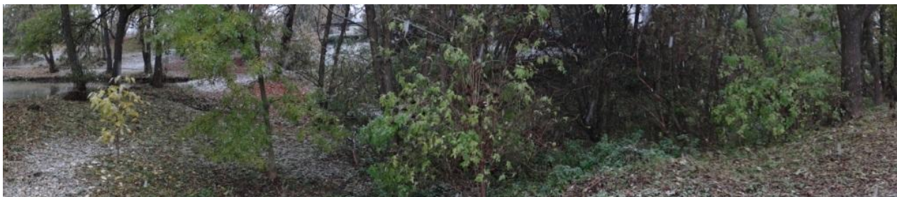
Celkový pohled na náves s rybníčkem a hluboce zařízlým korytem pod rybníčkem.