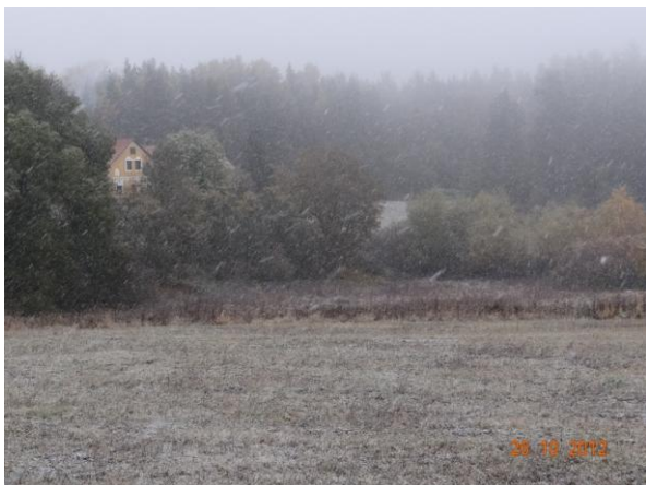
Údolnice toku pod lokalitou Nová Teplice.