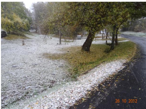
Úsek mezi komunikací a rybníčkem.