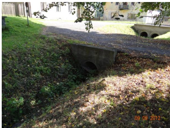
Limitní nekapacitní propusti - dojde k rozlivu.