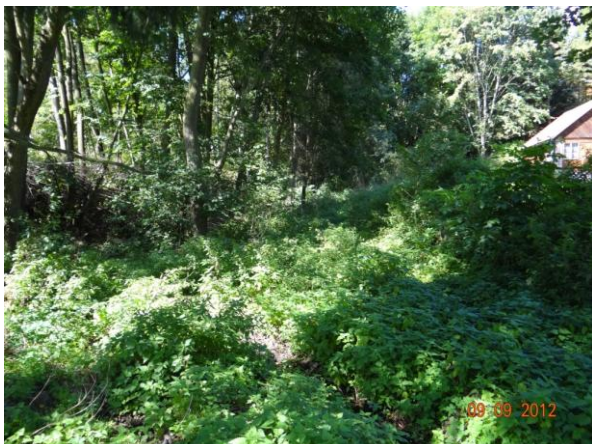
Koryto toku ve sběrné ploše pod chatami.