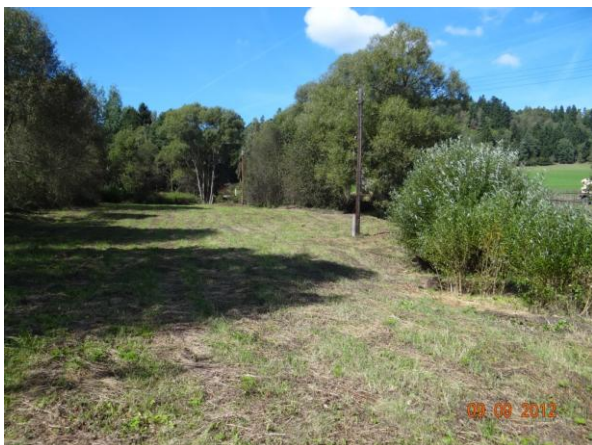
Koryto v intravilánu Lubů.