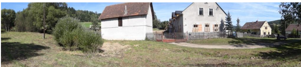
Celkový pohled na ohrožené nemovitosti č.p. 5, 6.