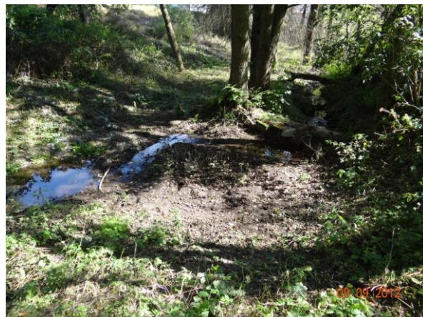
Koryto toku pod kritickým bodem.