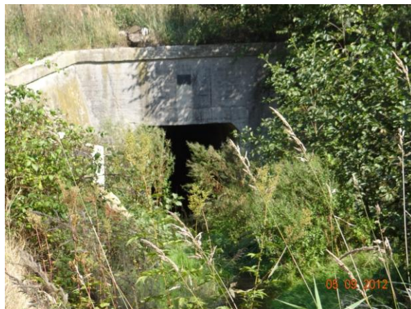
Vyústění krytého profilu pod výsypkou.