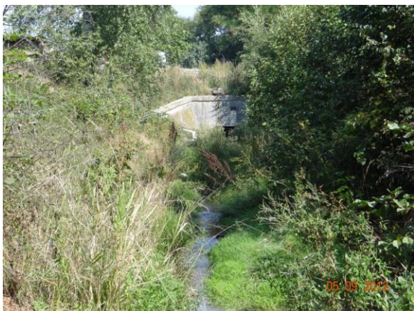
Kapacitní koryto mezi krytými profily.