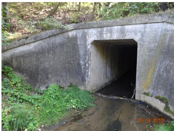
Nátok do krytého profilu pod nádražím.