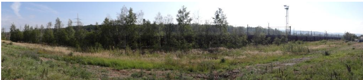
Úsek krytého profilu podél železniční trati.