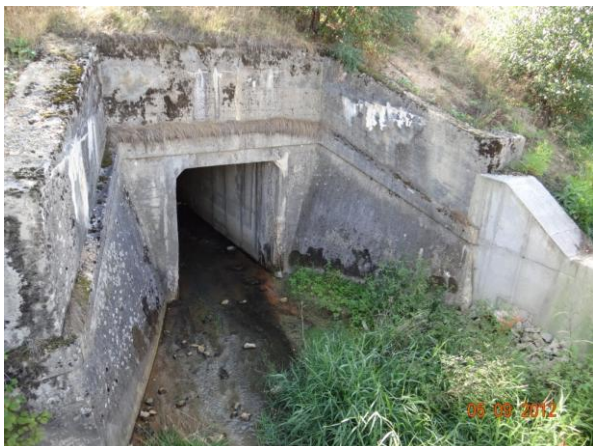
Nátok do krytého profilu pod výsypkou u (Žádný návrh).