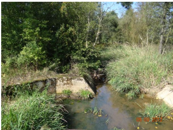
Koryto toku podél Chranišovského rybníka. Průtok omezuje ponechaný pařez v korytě.