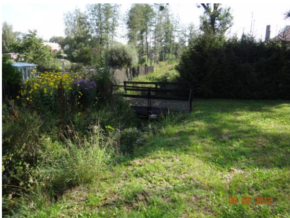
Koryto toku s lávkami podél obytné zástavby.