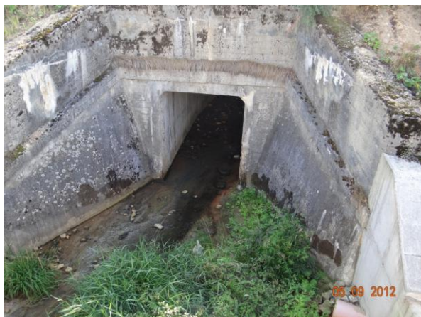
Nátok do krytého profilu pod výsypkou.