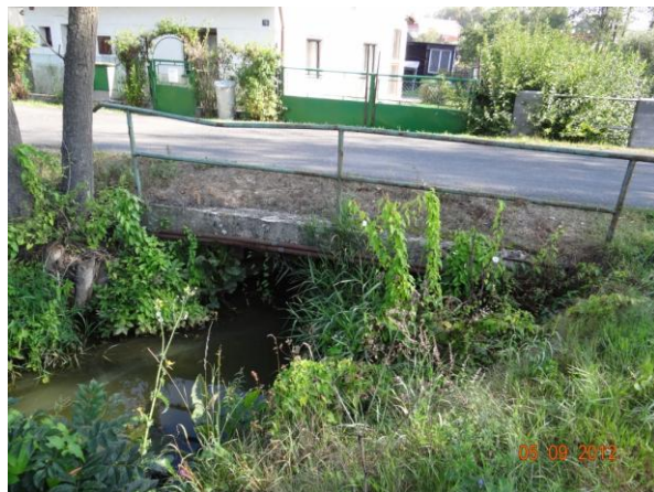
Most nad č.p. 18.