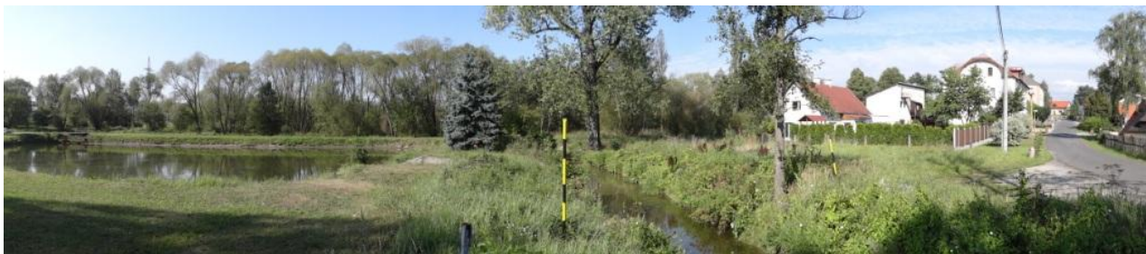
Celkový pohled na ohroženou lokalitu Chranišova.