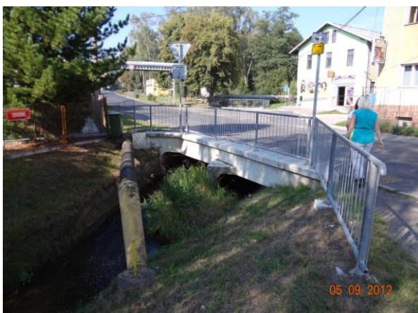
Nekapacitní profil nad autobusovým nádražím - kritické místo pro rozliv a ohrožení zástavby.