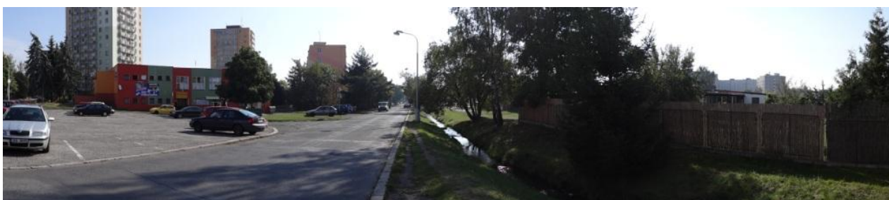
Celkový pohled na kritickou lokalitu rozlivu.