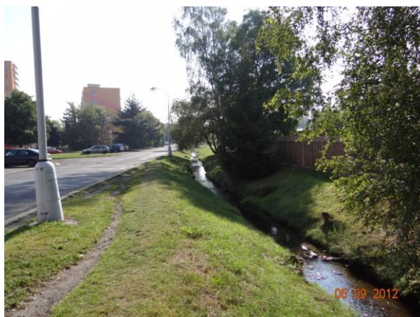
Nekapacitní koryto podél autobusového nádraží.