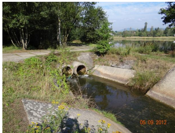
Nekapacitní trubní propusti u bezpečnostního přelivu Chodovského rybníka.