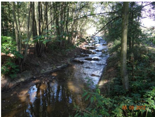
Regulované koryto nad Chodovským rybníkem.