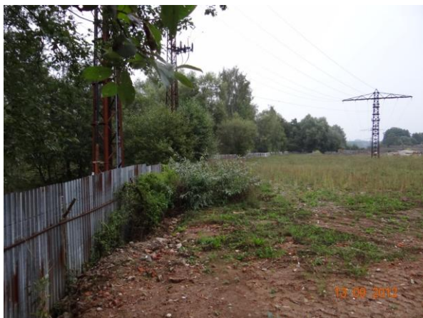
Průmyslový areál s krytým profilem toku.