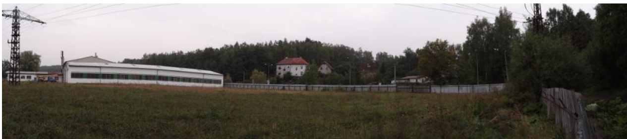
Celkový pohled na průmyslový areál nad zahrádkami.