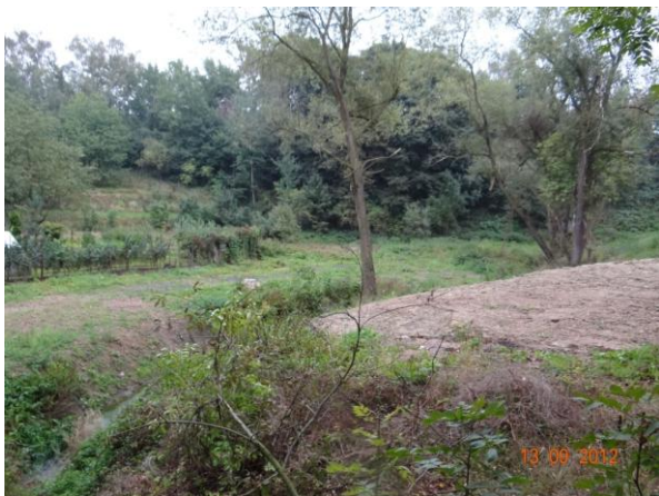
Tok mezi železnicí a komunikací II/606.