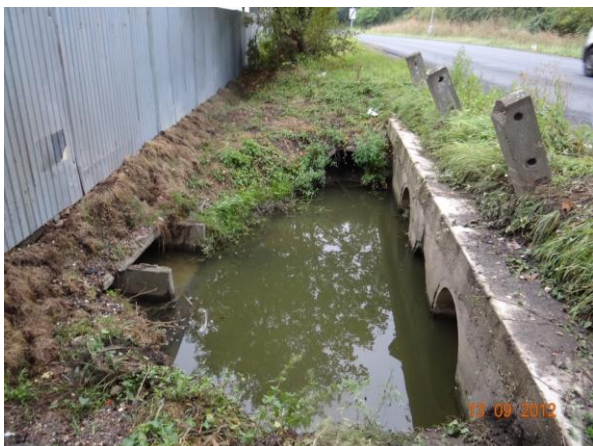
Vyčištěný nátok na nekapacitní krytý profil pod průmyslovým areálem.