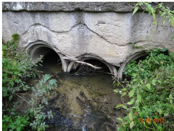
Částečně zanesené trubní propusti v náspu komunikace II/606.