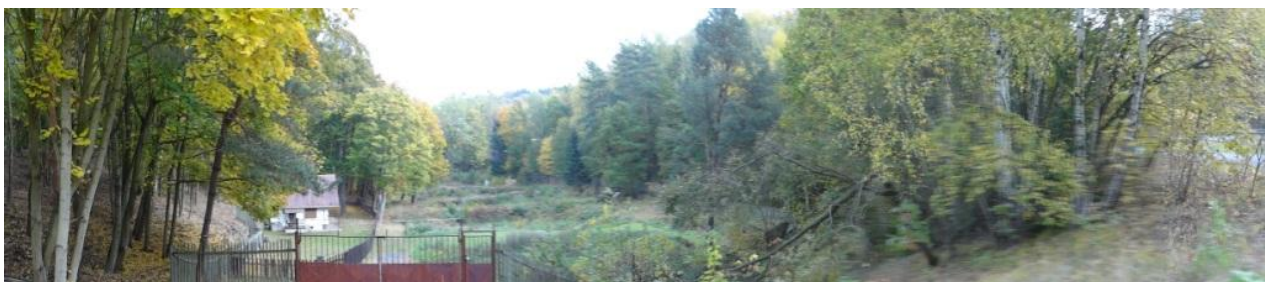
Celkový pohled na ohrožený areál.