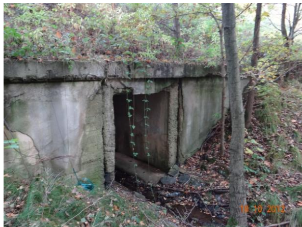
Propust v náspu komunikace II/606.