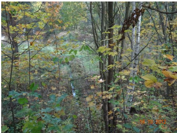
Vyústění toku pod komunikací do areálu sádek.