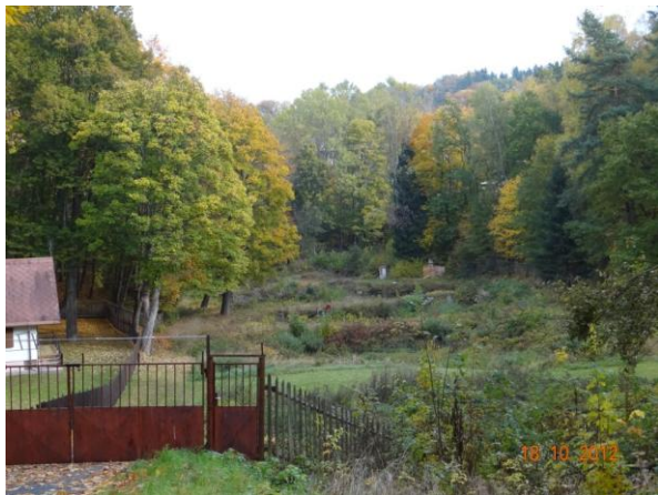
Areál sádek Mlýnek.