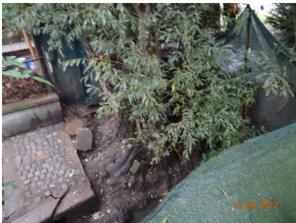
Pletivo s tkaninou nad mostem ve Střížově, dojde k nápěchu a přelití mostu.