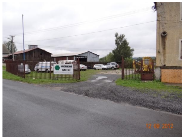
Ohrožená areál Autoservisu Kubík (č.p.6).