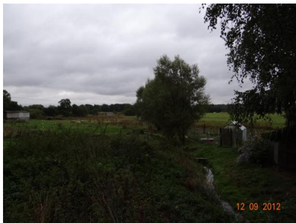
Koryto toku pod vyústěním krytého profilu.