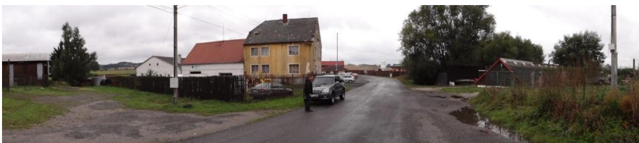
Celkový pohled a ohroženou zástavbu.