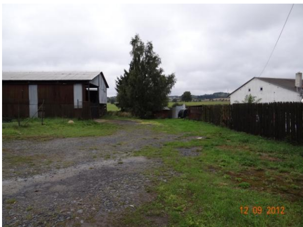
Úsek krytého profilu toku.