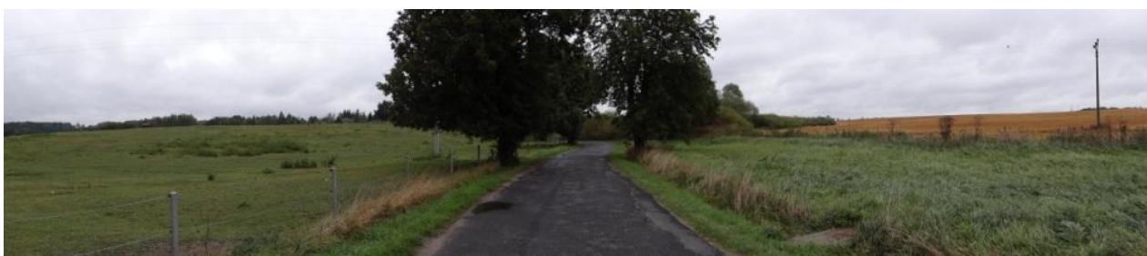
Celkový pohled na obě části sběrné plochy oddělené cestou.