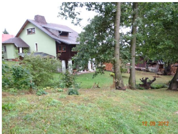
Sběrná plocha nad rekreačními objekty U Stekelových.