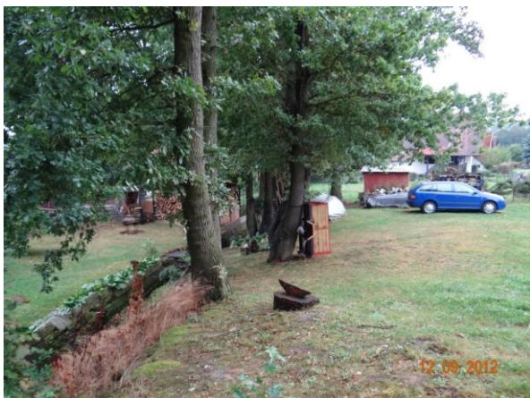
Ohrožené rekreační objekty.