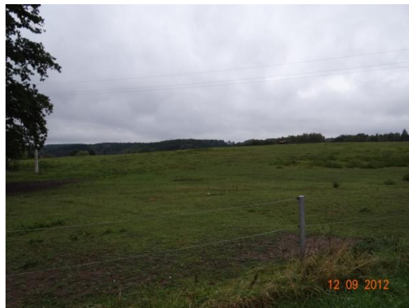
Korytu u rekreačních objektů v lokalitě Skalka.