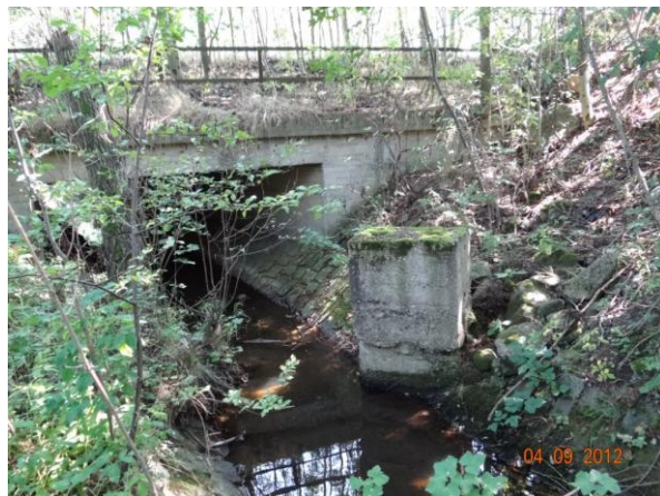
Železniční propust, může dojít ke kumulaci splávi na nefunkčním pilíři.