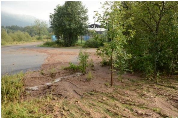
Důsledek přívalové srážky 25. 8. 2011 nad areálem PARABIT.