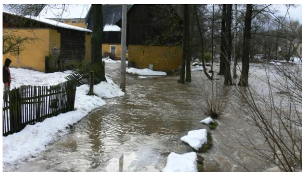
Ohrožená nemovitost č.e.1 v místní části Bystřice.