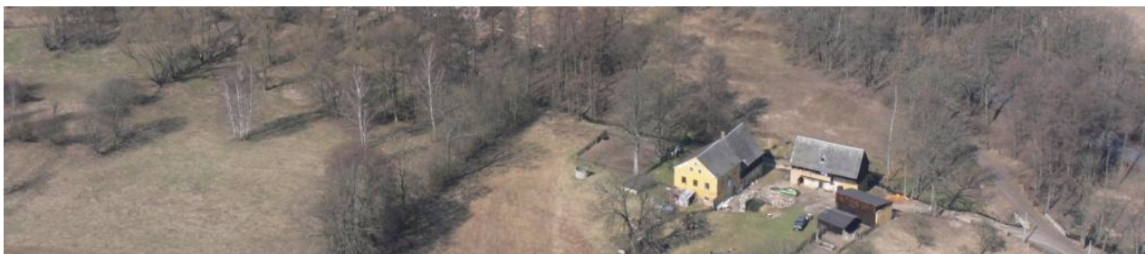
Celkový pohled na lokalitu č.e.1 v Bystřici.