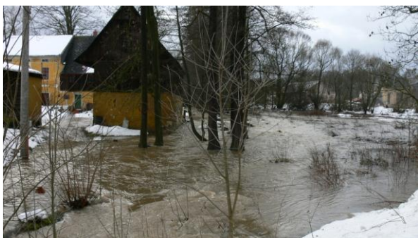
Ohrožená nemovitost č.e.1 v místní části Bystřice.