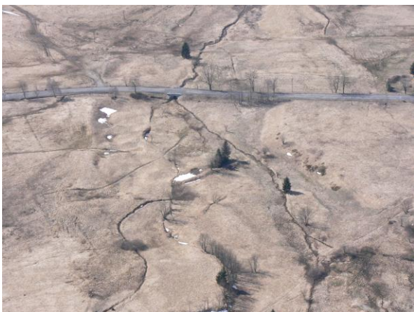
Ohrožená lokalita u rybníka.