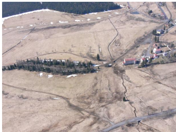
Silniční most 221-041 a železniční viadukt v trase toku.