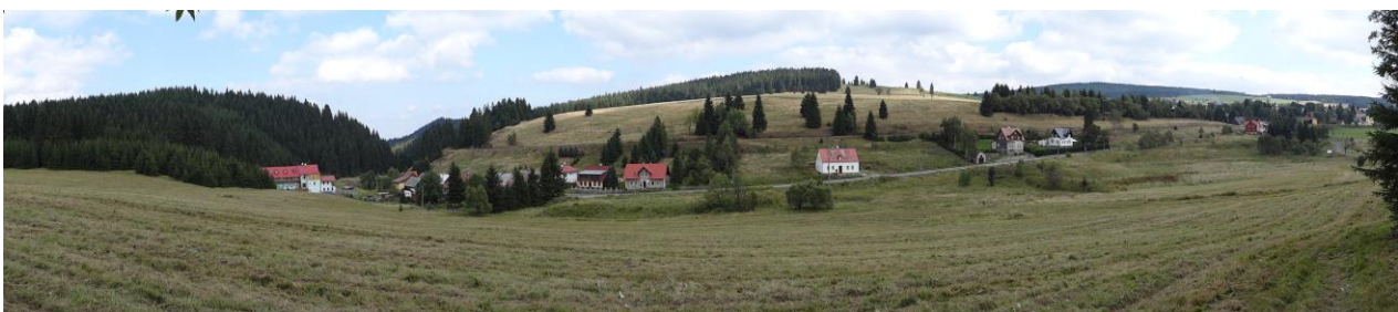
Celkový pohled na ulici Majakovského.