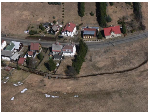
Ohrožené objekty v ulici Majakovského.