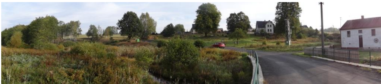
Celkový pohled na lokalitu.