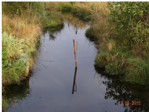
Ocelový profil I ponechaný v korytě nad mostem.