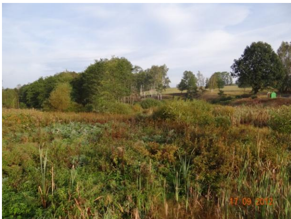
Niva Slatinného potoka nad mostem 21315-1 v Lipné.