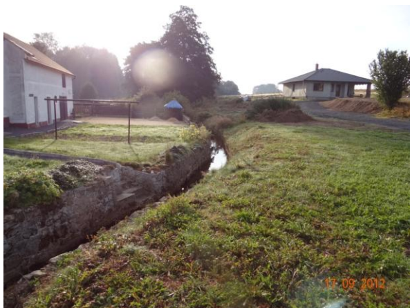
Tok pod mostem, ohrožen obytný objekt č.p. 7 a přístup k č.p. 11.