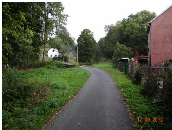
Cesta u č.p.48, objekt může být při rozlití ohrožen.