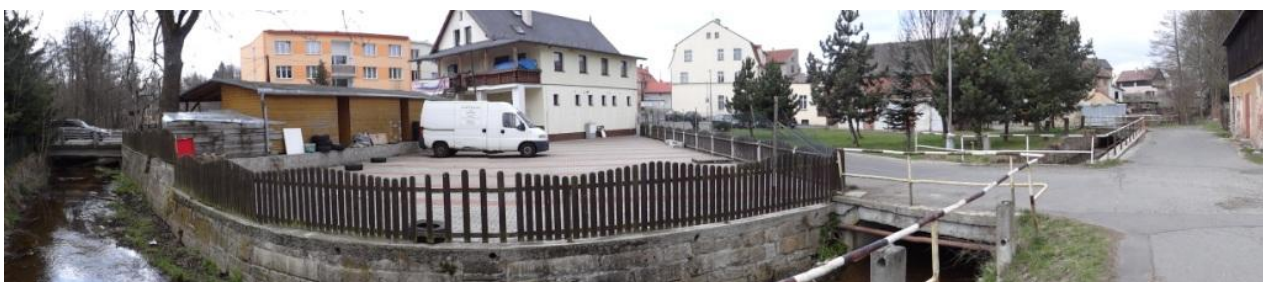
Celkový pohled na ohrožené centrum Hazlova.