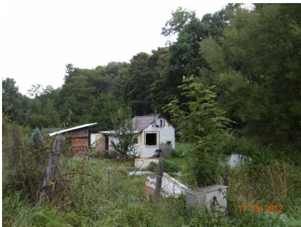
Objekty pod kritickým bodem.