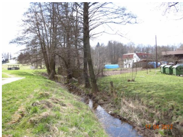
Koryto pod mostem 213-005A.