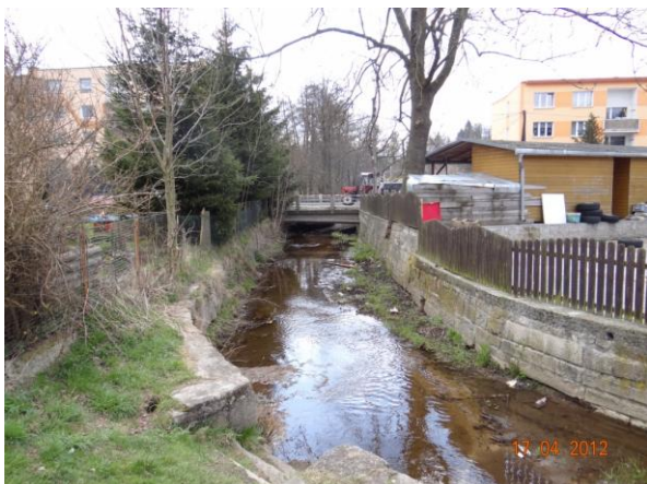
Centrum Hazlova, ohroženy oba břehy.