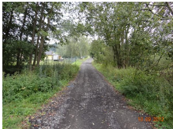
Cesta k obytným nemovitostem s trubní propustí.