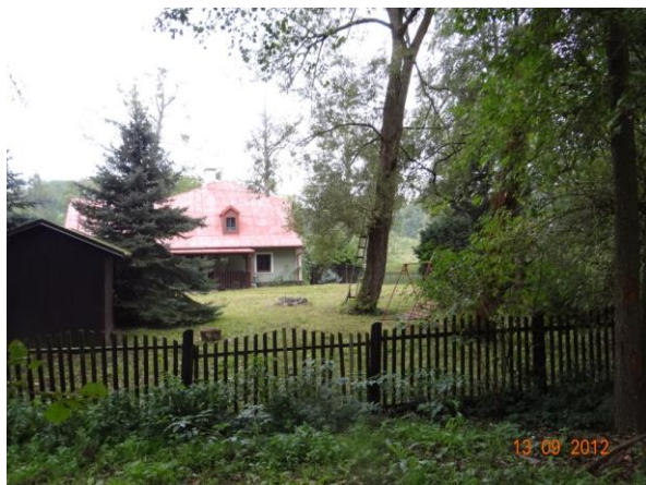
Ohrožený objekt č.p. 131.