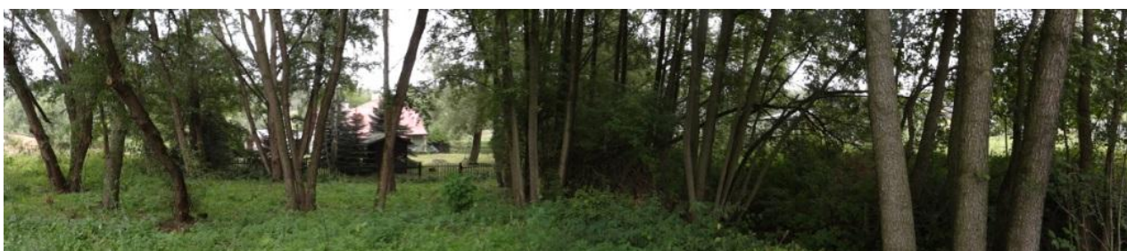
Celkový pohled na nivu toku pod kritickým bodem.