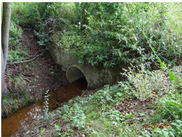
Nekapacitní trubní propust v cestě.