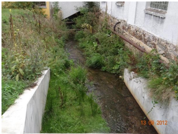
Nátok do krytého profilu v areálu KOVO.