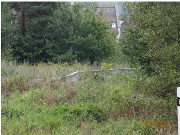
Protipovodňové zdi v lokalitě Klášterní Dvůr.