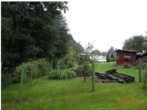
Zahrádkářská kolonie pod kritickým bodem.