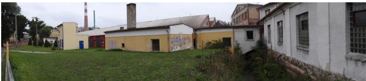
Celkový pohled na průmyslovou zástavbu nad krytým profilem.