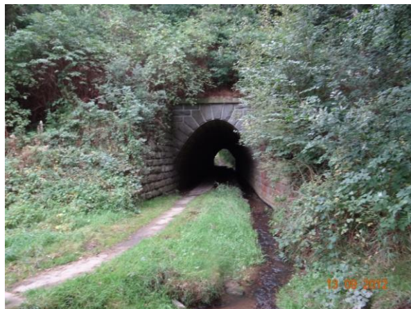
Železniční viadukt pod zahrádkářskou kolonií.