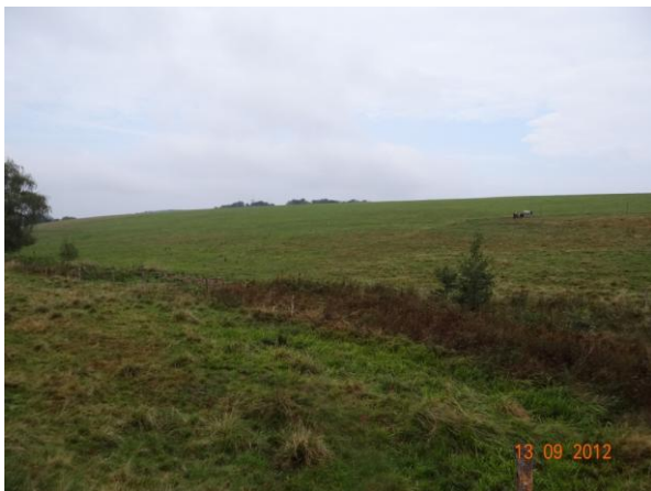
Sběrná plocha nad Dolním Pelhřimovem.