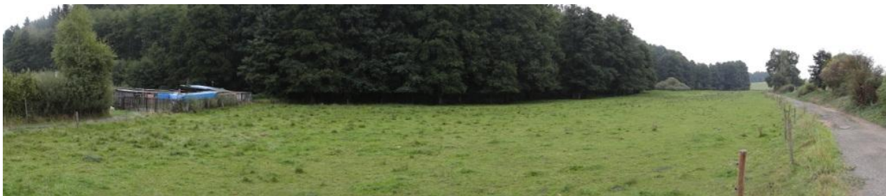
Celkový pohled na nivu toku nad zahrádkářskou kolonií v Chebu.