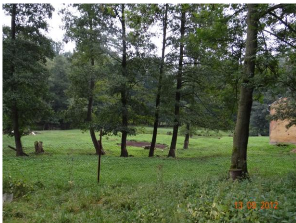
Niva toku pod Dolním Pelhřimovem.