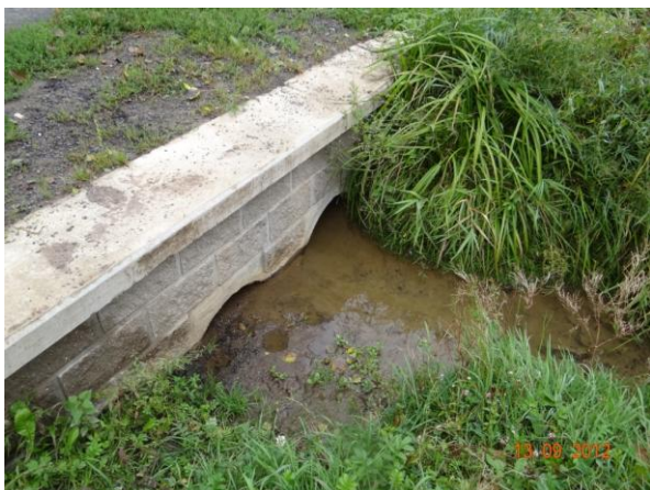
Zanesené trubní propusti na cestě ke statku.