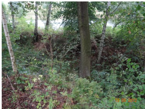
Koryto otku podél rybníka. Hráz neopevňená, neudržovaná.