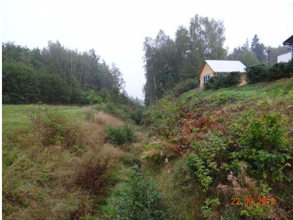
Koryto nad pilou Herkules.