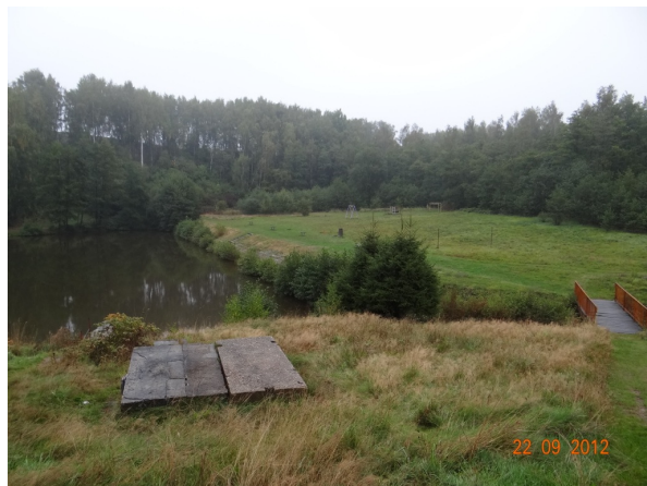
Přepad z lomu.