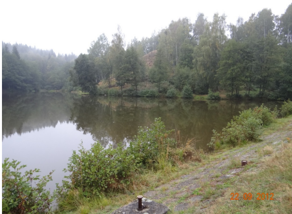
Lom na Radvanovském potoce.