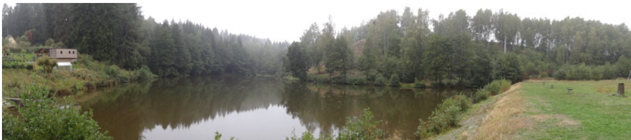
Celkový pohled na zatopený lom.