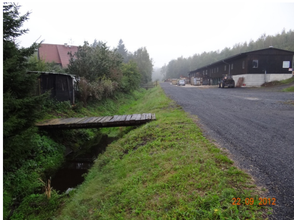
Koryto v areálu pily Herkules. Řezivo skladováno mimo potenciální rozliv.