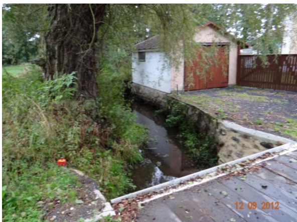
Mostek k č.p. 41, ohrožena minimálně garáž.