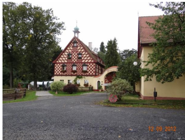
Štekerův mlýn - ohroženo zázemí a chovatelské plochy.