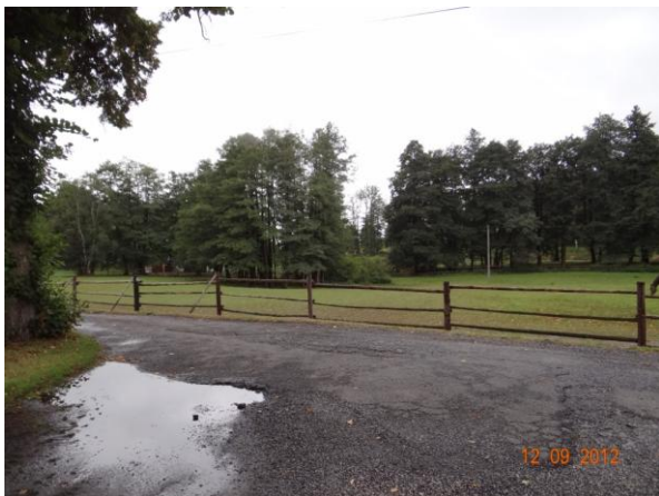
Pastviny pro koně u Štekerova mlýna (č.p.40).