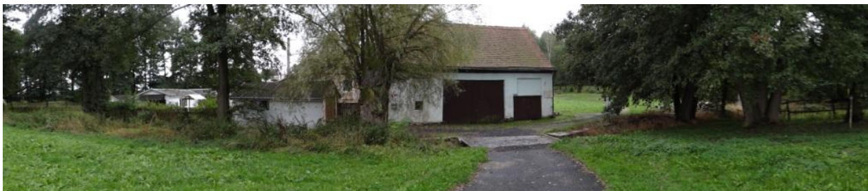
Celkový pohled na objekt č.p.41 a přístupový most.