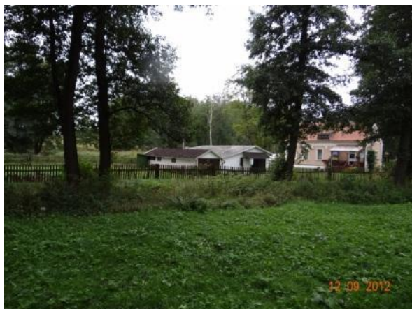
Objekt č.p.41 - doplňkové drobné objekty.