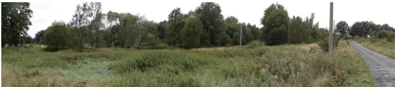
Celkový pohled na nivu toku.