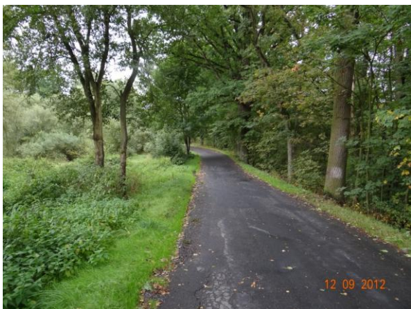
Komunikace III/21325 s trubní propustí v tělese náspu.