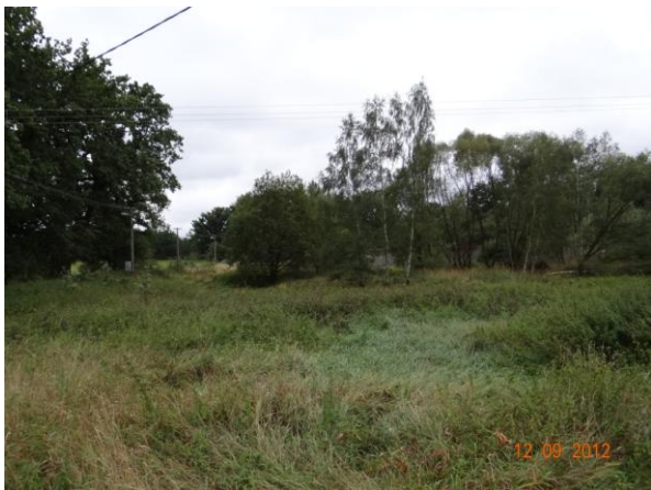
Místo kritického bodu nad č.p.49.