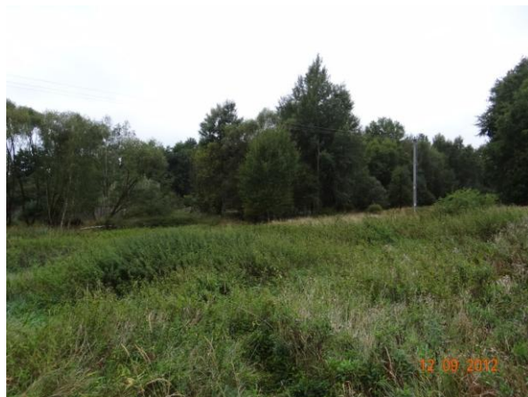
Plochá niva toku s možností rozlivů nad mostem pod č.p. 49.