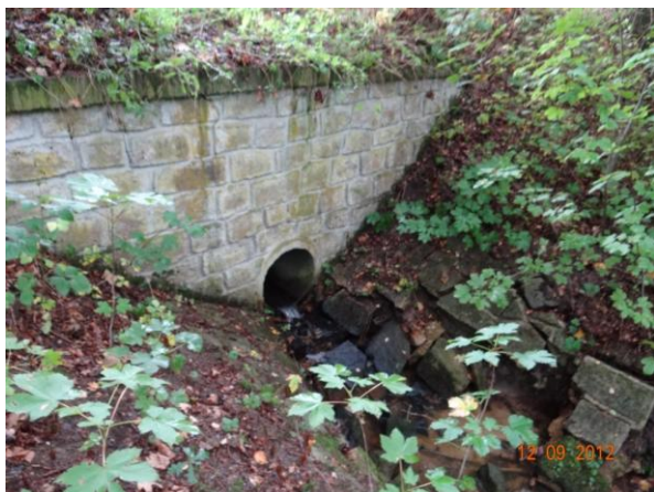
Detail trubní propusti v tělese komunikace.