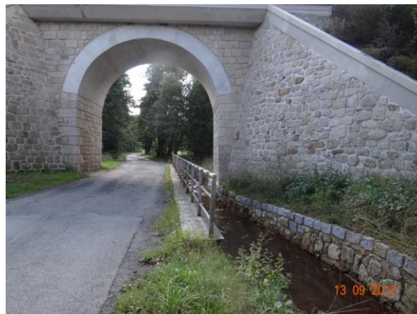
Železniční viadukt nad Horním Žandovem. Dojde k rozlivu na komunikaci.