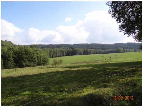
Sběrná plocha nad Horním Žandovem.