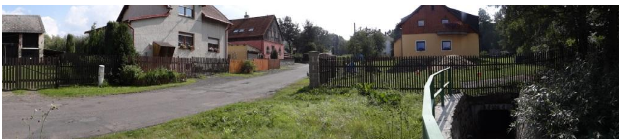
Celkový pohled na ohroženou zástavbu okolo krytého profilu.