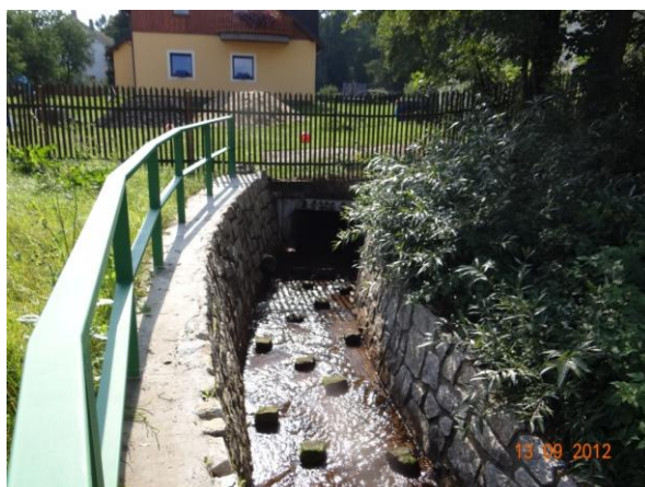
Krytý profil pod zahradou č.p. 38 v Horním Žandově.