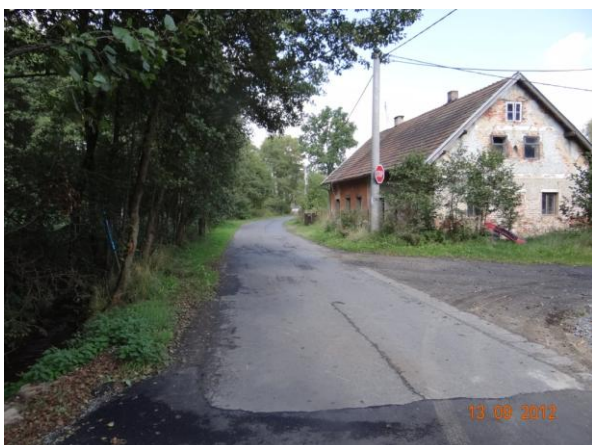
Zástavba podél zaplavované komunikace (č.p. 44).