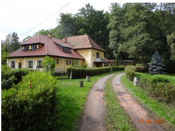
Ohrožený objekt Hubertusu (č.p.67).