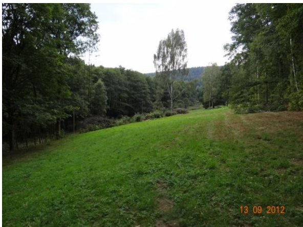
Hluboké údolí toku sběrné plochy nad kritickým bodem.