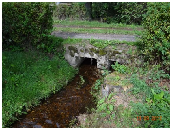
Mostek u Hubertusu.