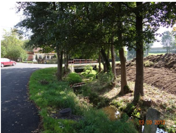
Koryto toku za garážemi, rozliv omezený současnou navázkou na LB.