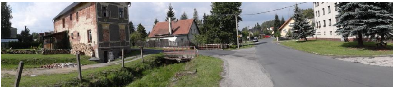
Celkový pohled na ohrožené centrum Dolního Žandova u č.p.143.