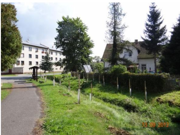
Ohrožené centrum Dolního Žandova.