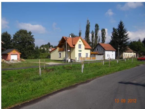
RD podél revitalizovaného úseku toku.