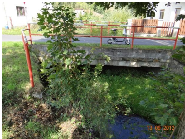
Příklad mostů v obci - mostovky nízko nad korytem, nekapacitní profily náchylné k záchytu splávi.