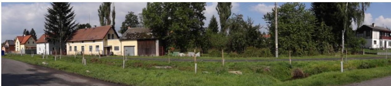
Celkový pohled na zástavbu RD podél revitalizovaného úseku toku.