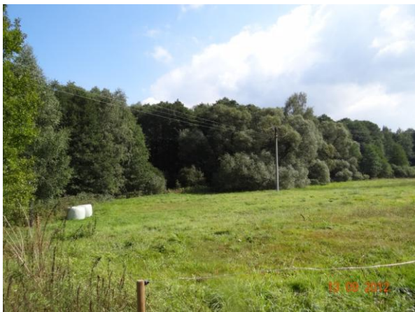
Niva toku nad Dolním Žandovem.