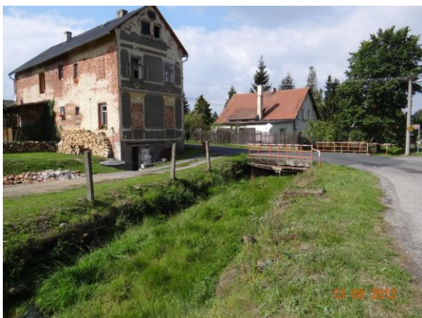
Ohrožené centrum Dolního Žandova.