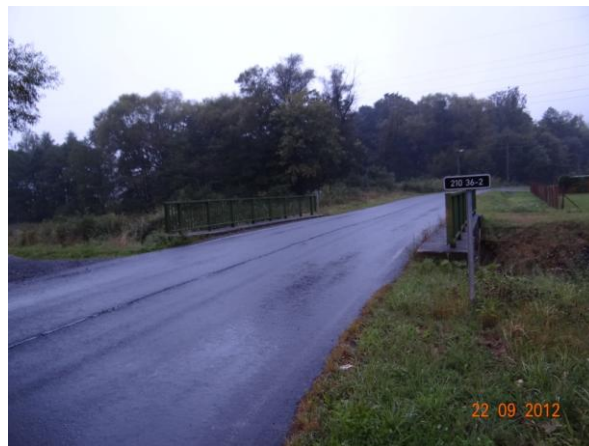
Most 210 36-2 pod kritickým bodem.