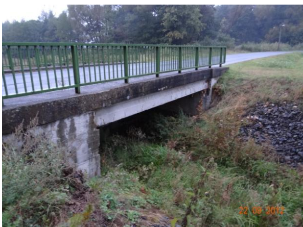
Detail mostu 210 36-2.