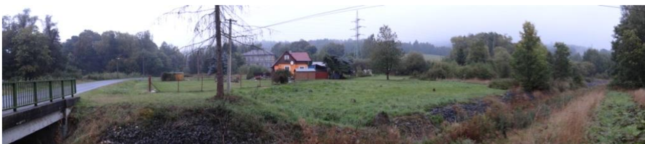
Celkový pohled na ohroženou lokalitu, v pozadí objekt č.p. 7.