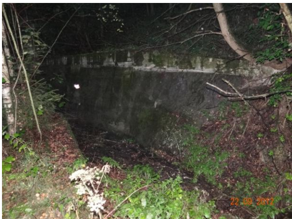
Regulované koryto nad Boučím - vysoký spád toku.