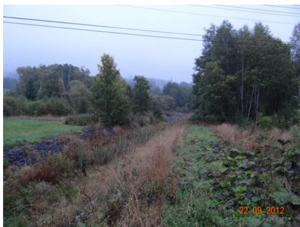
Niva toku nad mostem.