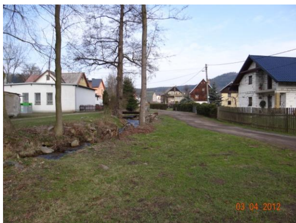
Dolní Děpoltovice - niva toku širší, dojde k rozsáhlejšímu rozlivům.