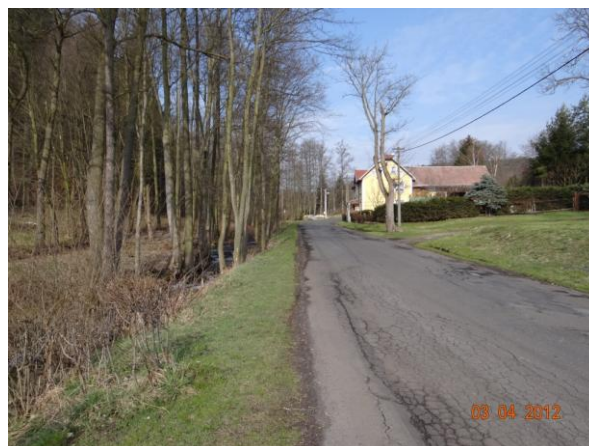
Niva toku v horních Děpoltovicích.