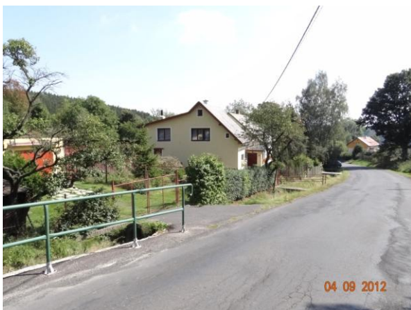
Fojtov - tok prochází podél komunikace a zástavby.