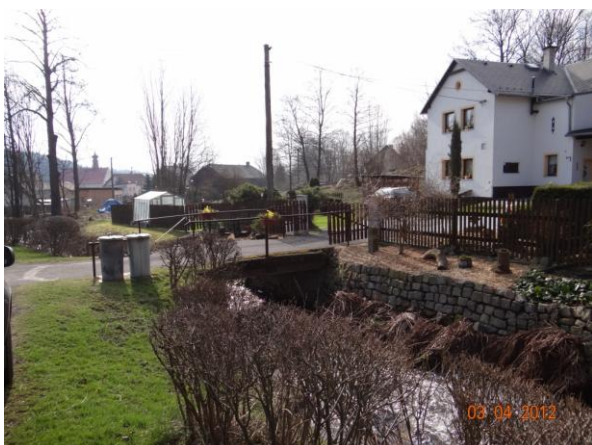
Situaci zkomplikuje řada mostů a lávek.