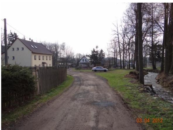
Dolní Děpoltovice - niva toku širší, dojde k rozsáhlejším rozlivům.