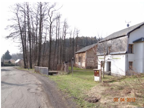
Charakter zástavby pod kritickým bodem - nemovitosti velmi blízko koryta.