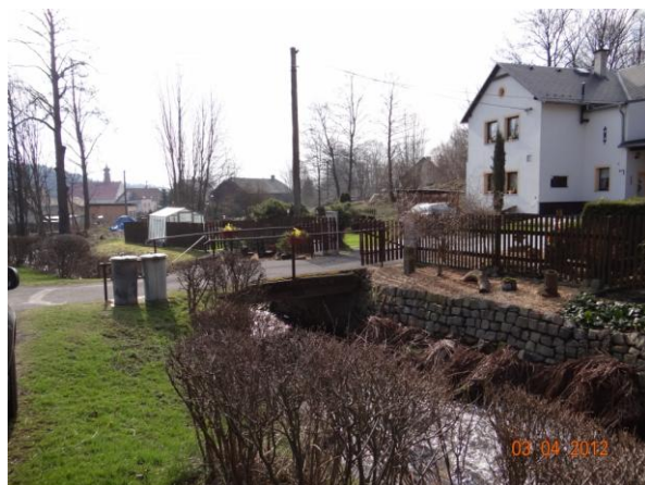
Situaci zkomplikuje řada mostů a lávek.