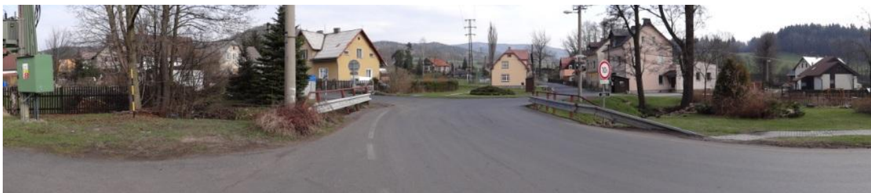
Centrum obce s mostem 2204-1, ten bude pravděpodobně přelit a dojde k významnému omezení dopravy.