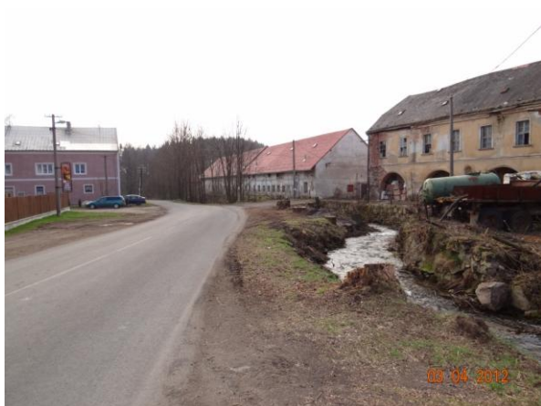
Lokalita u statku.