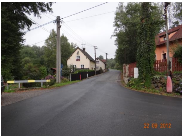
Ohrožené objekty č.p. 60,80 nad ústím do Habartovského potoka.