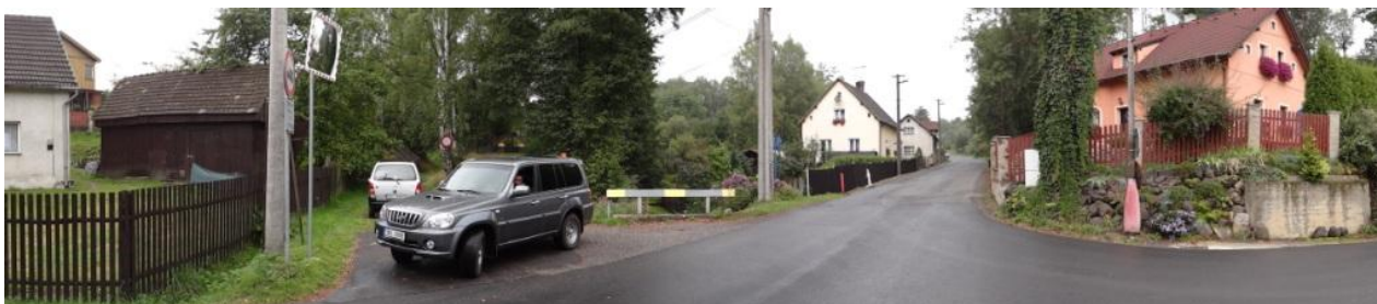
Celkový pohled na lokalitu hlásného profilu C2.