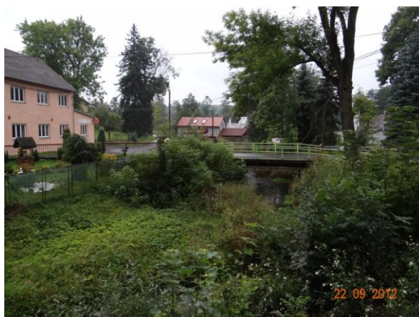
Náves u hospody - místo rozlivů do zástavby.