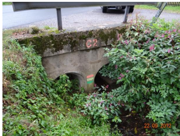
Hlásný profil C2 na mostu pod č.p. 80. Trubní propusti budou pravděpodobně zahlceny.