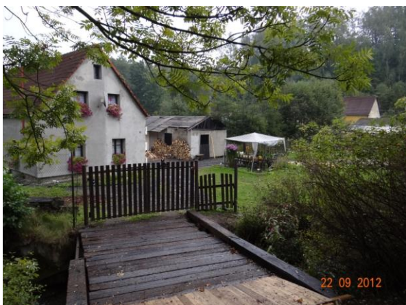
Ohrožený objekt č.p. 34 pod ústím do Habartovského potoka.