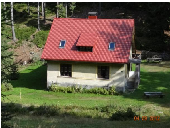
Červená hájenka, první ohrožený objekt v lokalitě Ryžovna.