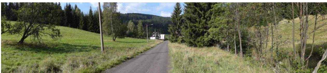
Celkový pohled na úzkou nivu toku.