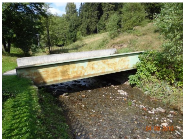
Příklad náhodně řešených mostků k rekreačním objektům a k účelovým cestám.