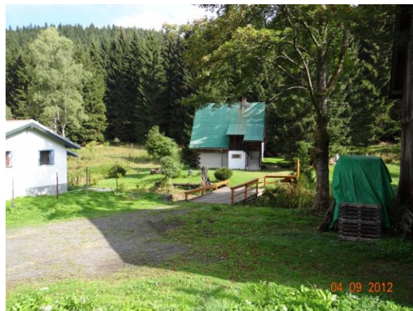
Rekreační objekty ohrožené rozlivy u nekapacitních mostů náchylných k záchytnu splávní.