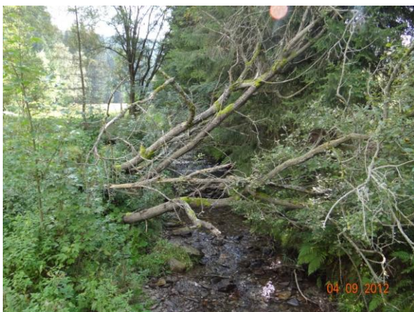
Koryto je v některých úsecích intravilánu udržované.