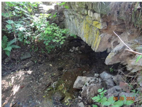
Kamenný klenbový staticky narušený most na cestě pod objektem č.p. 1.