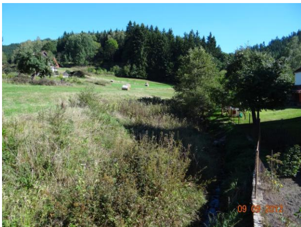
Pohled ke kritickému bodu a do sběrné plochy.