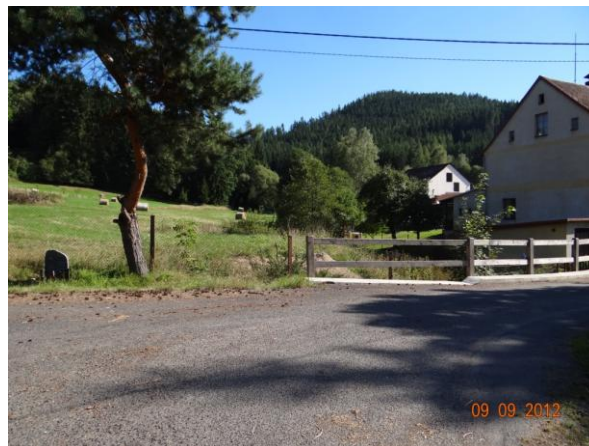
Ohrožená nemovitost č.p. 1.