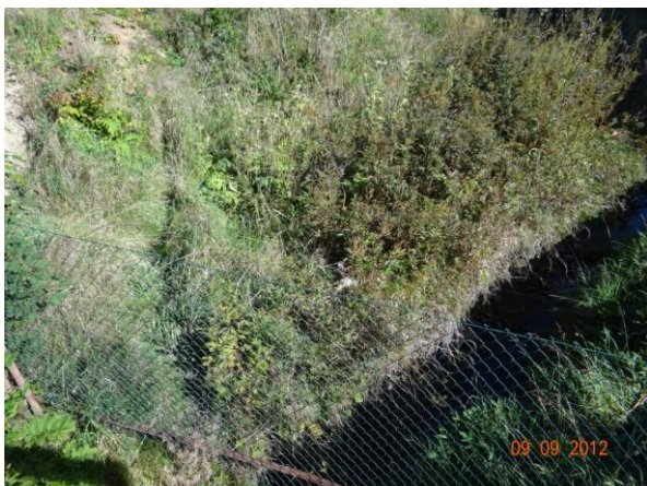
Pletivový plot přes koryto přímo nad mostem, dojde k ucpání profilu mostu.