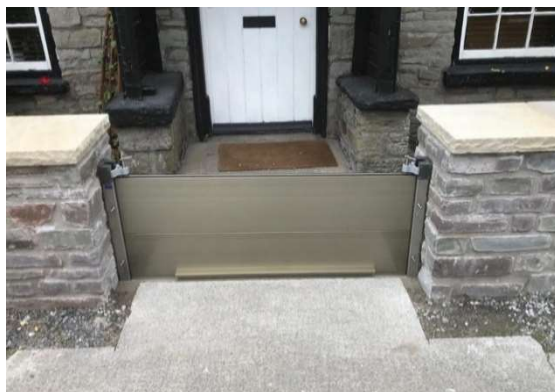
Provizorní mobilní hrazení v rámci podezdávky zahrady