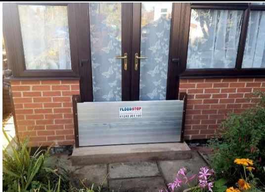
Provizorní mobilní hrazení vstupu do objektu