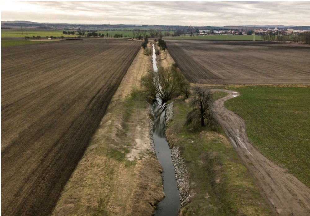
Zemní hráz podél vodního toku Výrovka